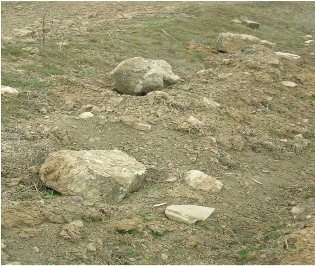
El laboreo saca a la superficie material arqueológico en el sitio “La Ciudad”